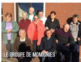
LE GROUPE DE MOMIGNIES