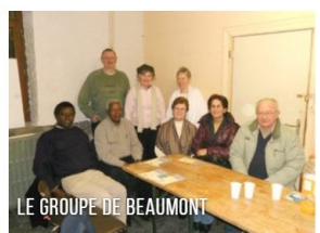
LE GROUPE DE BEAUMONT