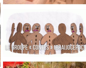
LE GROUPE « CONTES » (BRAJJOEPOC)