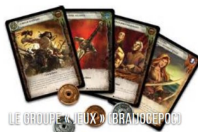
LE GROUPE « JEUX » (BRAJJOEPOC)