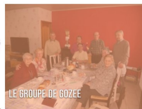
LE GROUPE DE GOZEE